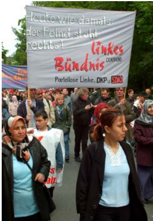
Gemeinsam gegen Rechts

Die Nazis, die hier gegen eine Moschee hetzen, hetzen in Bochum gegen eine Synagoge und sie schrecken vor keinem Verbrechen zurück. Stellvertretend für die vielen Anschläge, Überfälle und Morde (in der Presse findet davon nur noch ein kleiner Teil Erwähnung) nenne ich das geplante Bombenattentat in München zur Grundsteinlegung einer Synagoge vor einem Jahr.