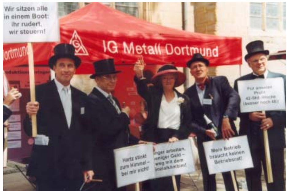
Die Realität holt die Satire ein ...

Nicht nur Stoiber spricht von einem „Zukunftsmodell“. Die Offensive der