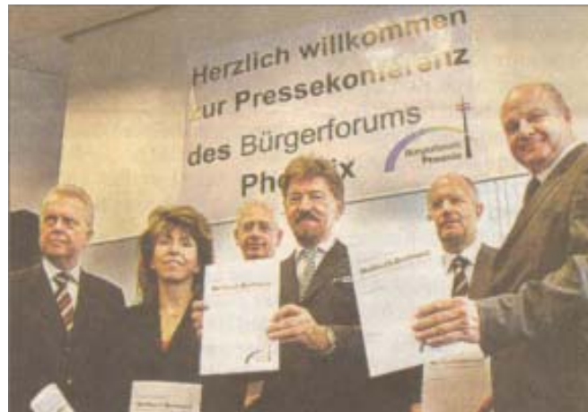
Alter Wein in alten Schläuchen: Unternehmer fordern Privatisierungen